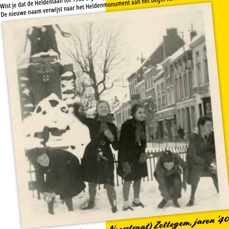
Heldenlaan (vroeger Neerstraat) Zottegem, jaren '40

Wist je dat de Heldenlaan tot 1933 eigenlijk de Neerstraat heette? De nieuwe naam verwijst naar het Heldenmonument aan het begin van de Heldenlaan!