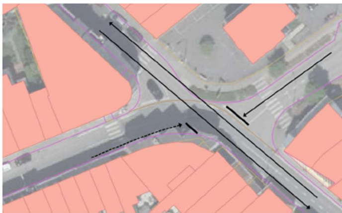
Figuur 30: Wijziging voorrangsregeling Broeder Mareslaan x Godverdegemstraat

Deze opwaardering vereist niet enkel een aanpassing van verkeersborden en wegmarkeringen, maar vereist een structurele herinrichting van het wegbeeld zodoende het voor de weggebruiker duidelijk is wat de hoofdweg is. Momenteel bestaat de rijweg namelijk uit verschillende soorten wegverharding (asfalt en klinkers) en is er geen rechtlijnige verbinding tussen de Godverdegemstraat en Broeder Mareslaan door de aanwezigheid van een plantvak en de greppel: