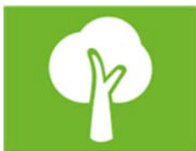
natuur, milieu en energie