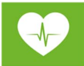
zorg en gezondheid